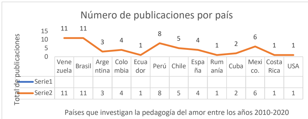
Figura 2: Distribución de número de publicaciones en países sobre temas relacionados con la pedagogía del amor